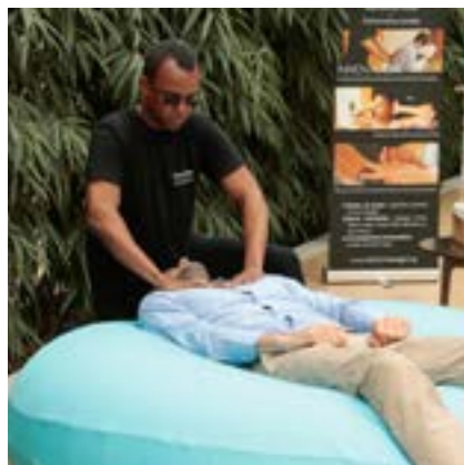
relaxation en apesanteur