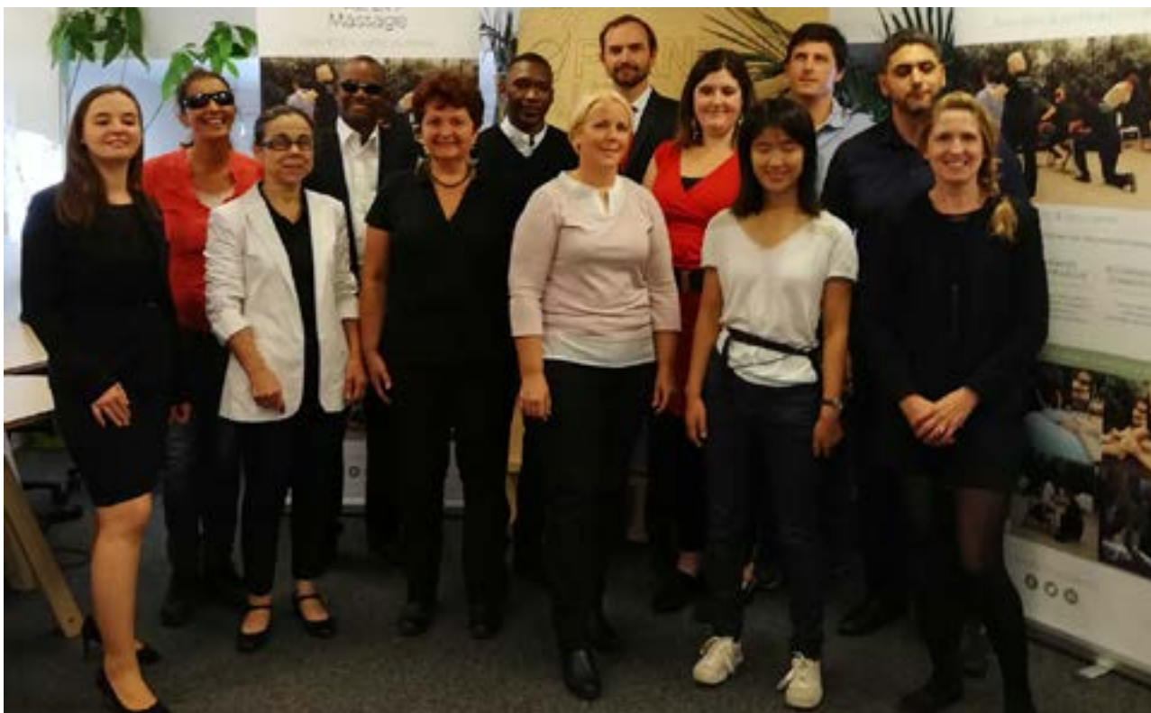
L'équipe, composée de praticiens mal ou non-voyants et de fonctions support