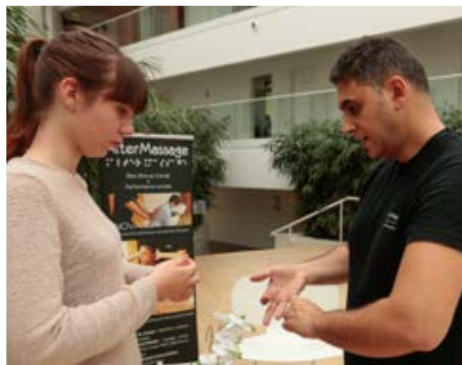
Apprendre l'auto-massage redynamisant